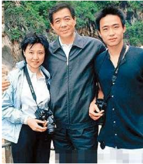
薄熙來與兩任妻子關係圖