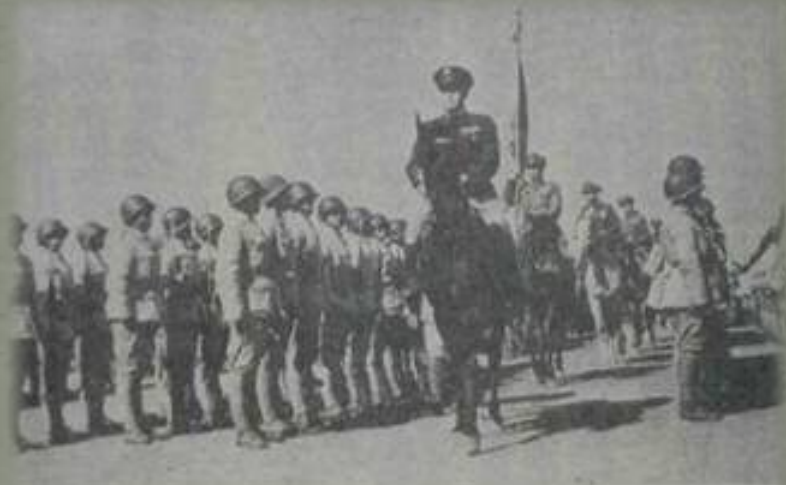
上：孫立人將軍交卸新一軍軍長前的最後一次閱兵。

8月初，新一軍已抵西江南岸粵桂交界處，不久日本宣佈無條件投降。於是，順江而下，接收了廣州、深圳。孫立人不忘緬北抗日死去的烈士，勝利後不久，舉行了三十八師副師長齊學啟和二〇〇師師長戴安瀾的追悼會，孫立人親自寫了悼詞表示哀悼。並從全軍官兵薪餉中扣出一部分錢來，利用日軍俘虜，在廣州白雲山上修築了新一軍緬北抗敵陣亡將士紀念碑，碑上有一隻鷹圖案和他的題字。