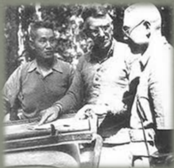
孫立人、史迪威和廖耀湘