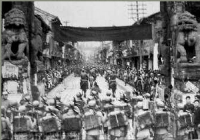
印緬遠征軍回昆明受到熱烈歡迎