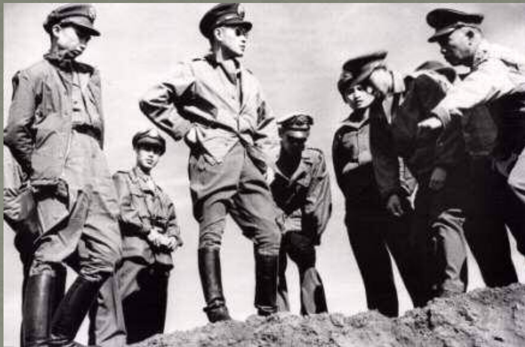
孫立人（中）視察前線，1947年長春。