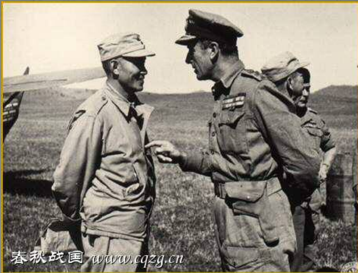
英国远东军司令蒙巴顿勋爵与孙立人在一起