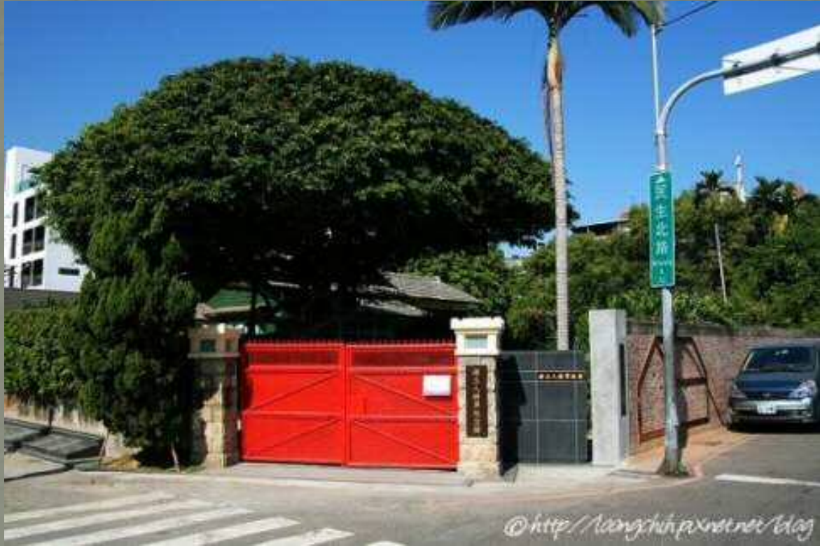
孫立人將軍紀念館