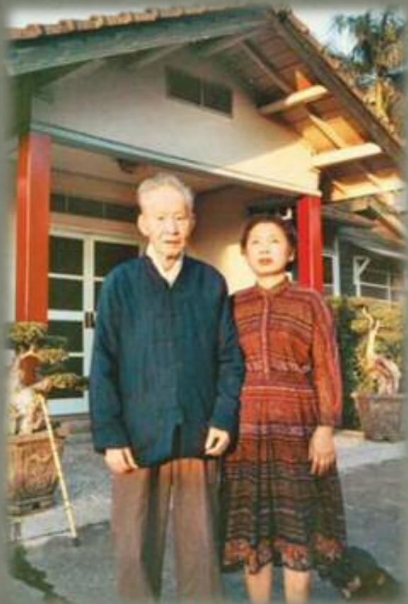
孫立人在台中市向上路寓所與妻子合影。