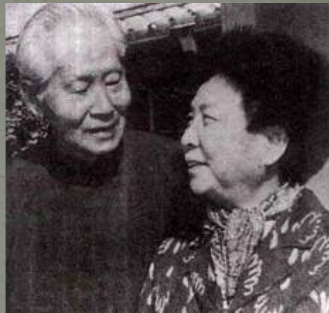
1988年恢复自由的孙立人与夫人张晶英在台中市向上路寓所