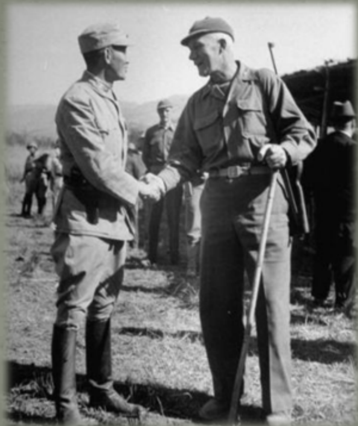
1945年2月：孫立人和劉易斯將軍在印度

從1938年底，到1941年底，稅警總團在都勻整整訓練了三年，使這支非正規部隊成為當時國民黨最精銳的部隊之一，孫立人也一舉成了一位兵精糧足、羽翼豐滿的實力派人物。