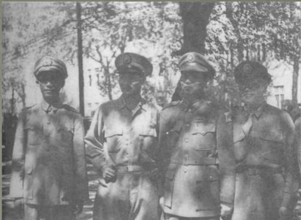
左起：新1军30师师长潘裕昆,孙立人,东北保安副司令长官梁华盛,廖耀湘