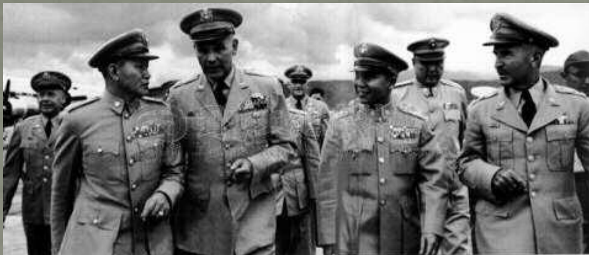
韓戰爆發使美軍協防台灣，美軍與台灣的軍事合作日趨密切，並隨中美共同防禦條約的簽訂達到最高峰。圖為美軍駐韓第八軍團司令泰勒上將抵台訪問，自左至右分別為中美重要軍事將領：孫立人、泰勒、彭孟緝、蔡斯。