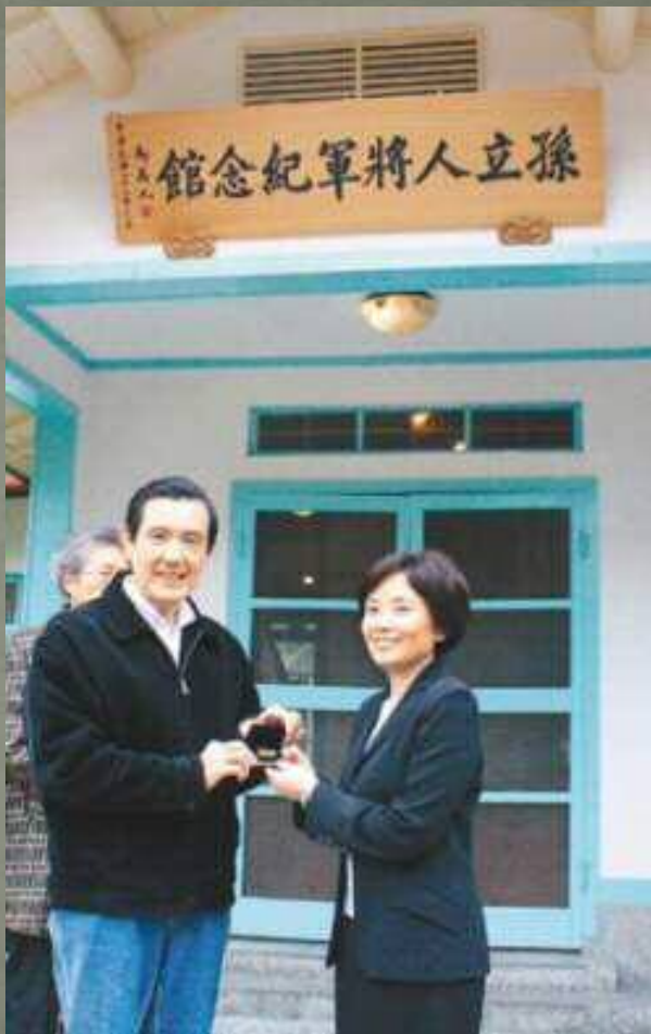
馬英九至孫立人紀念館前揭幕