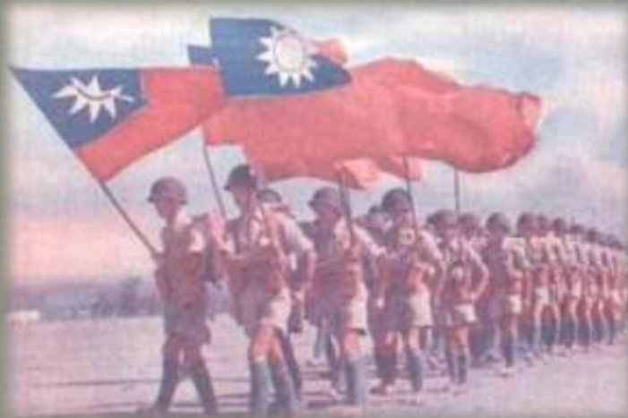
Parade of US equipped Chinese Army in India jpg