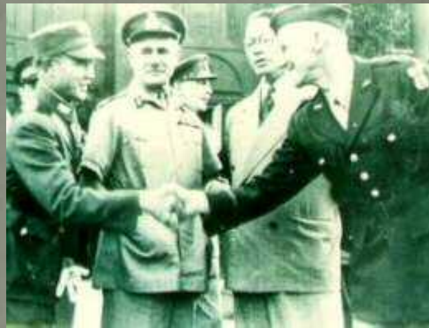
孫立人將軍與史迪威

孫立人對這種人事安排當然不滿，但又沒有辦法，只能暗中怨恨。後來經過一番活動，由美國人出面，以孫立人練兵有方，調往台灣去訓練新兵，並從新一軍軍部及三十八師調去幾百個在稅警總團和印緬時期的親信隨同前往，另起爐灶。三十八師也脫離新一軍另成立新七軍，以李鴻為軍長，歸鄭洞國領導，仍駐長春。新一軍軍長潘裕昆率五十師及新編入的其他部隊駐防瀋陽。