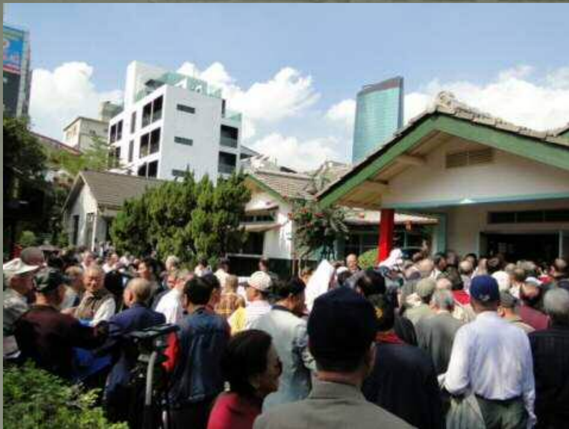
孫立人將軍老老部屬在烈日下,等待進入故宅參觀