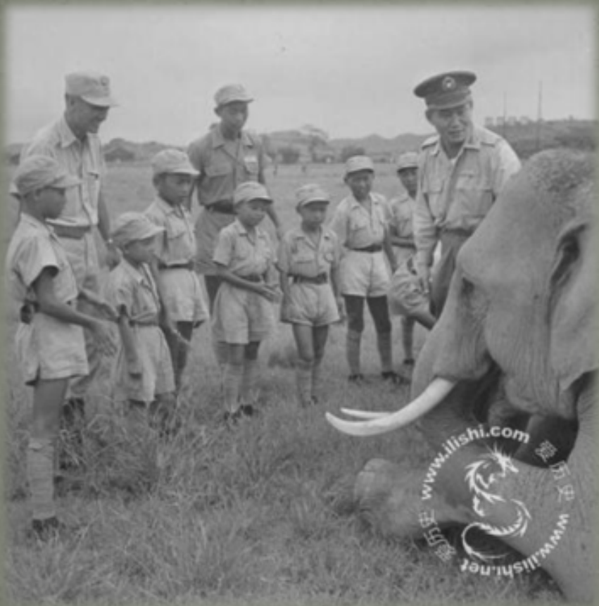
孫立人帶著一群娃娃看大象