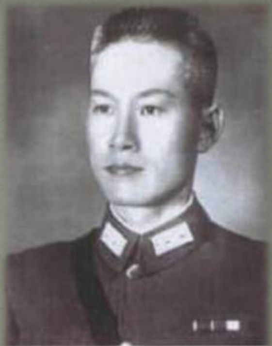
抗战期间的中国远征军第三十五军 指挥官孙立人

1940年，緝私總隊又改還原為稅警總團，總團部設教導隊，分士兵隊和軍官隊兩類，每期三個月。軍官教導隊除訓練在職軍官外，還招收高中畢業生，經八個月訓練，畢業後給准尉待遇，在連排當見習軍官，成績好的就按正式軍官晉陞。即使是國民黨其他軍校畢業的軍官，分配到稅警總團來，也必須入軍官教導隊接受這一套“孫氏訓練”，否則，到什麼時候都被認為是“外江派”，得不到升遷和重用。