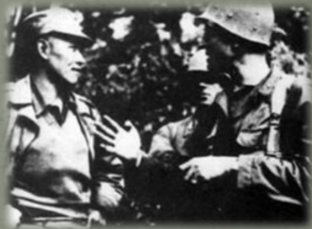
孫立人（左）在皎梅與英軍會師，緬甸全境光復

第二仗是孟拱河谷的戰鬥，仍是二十二、三十八兩個師擔任主攻，敵人是十八師團殘部和第二師團。孟拱是緬北重鎮，為水陸碼頭，兩岸高山密林，易守難攻，日軍在這裡築有永久性工事，但在我軍強大攻勢下，傷亡5000人，棄城而逃，連司令部的關防也被孫部繳獲。這次戰鬥，孫部還解救了英軍第七十七旅。該旅旅長親來三十八師感謝救命之恩。1944年8月初，中國駐印軍攻佔密支那，奉命修整擴編為兩個軍，即新一軍和新六軍，孫立人任新一軍軍長，轄新編三十八師、新編三十師。