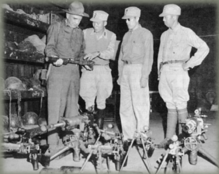
Sultan將軍與孫立人將軍研究逃亡的日本軍隊留在momauk緬甸的武器設備

1946年2月，新一軍4萬多人馬輜重，借道香港，在美國軍艦護送下，開向東北。首先在秦皇島登陸，然後乘火車到錦州一帶集中。途中受到東北民主聯軍的襲擊，傷亡頗重。不久孫立人又一次出國到倫敦受勳，全軍由副軍長率領，輾轉迂迴到瀋陽週邊。在四平街，新一軍同東北民主聯軍激戰一個月，傷亡慘重，卻攻不下一個小小的四平街，蔣介石非常不滿。這時，孫立人已經回國，急忙從關內趕來指揮戰鬥。也是他運氣好，東北民主聯軍在保衛四平街的戰鬥中，贏得了時間，正作戰略轉移。因此，新一軍一舉而下吉林、長春、德惠，陳兵松花江畔。這又給孫立人鍍了一層金粉。