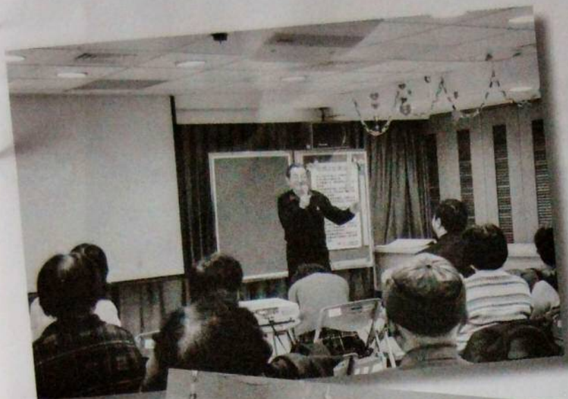
→在萬華老服服務台協助諮詢服務