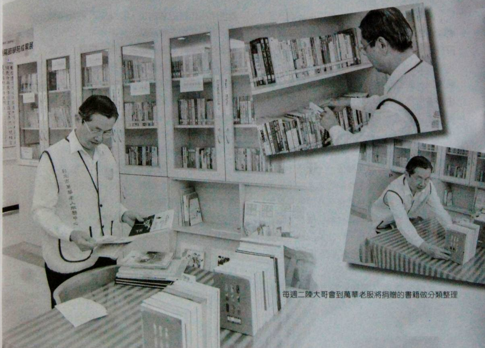
每週二陳大哥會到萬華老服將捐贈的書籍做分類整理

來『快樂』並不是來自物質條件的回報或名利的收獲，而是來自內心真正的知足。隨時只要心存『感恩』和『愛心』，抱持積極樂觀的服務態度，服務有需要的人，生活便覺得快樂。當我們服務失智長輩時，自己就是在成長，會有一種成就感；這種成長與成就感交織的喜悅，乃是欣慰平安的快樂。