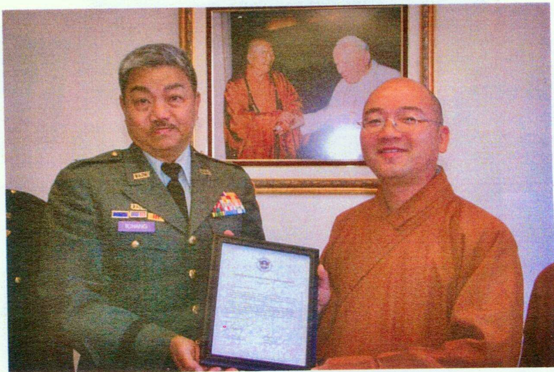
張司令向西來寺主持致贈感謝狀