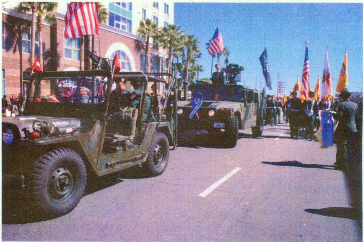
本軍團遊行前導車隊