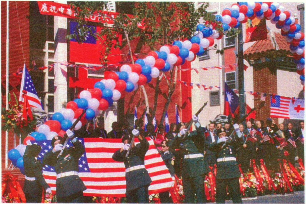
雙十國慶鳴槍慶祝