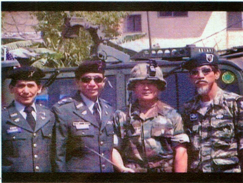
本軍團訪問美軍基地