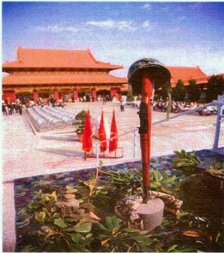
2007年本軍團在美國洛杉磯西來寺舉辦 華裔陣亡美軍追悼會