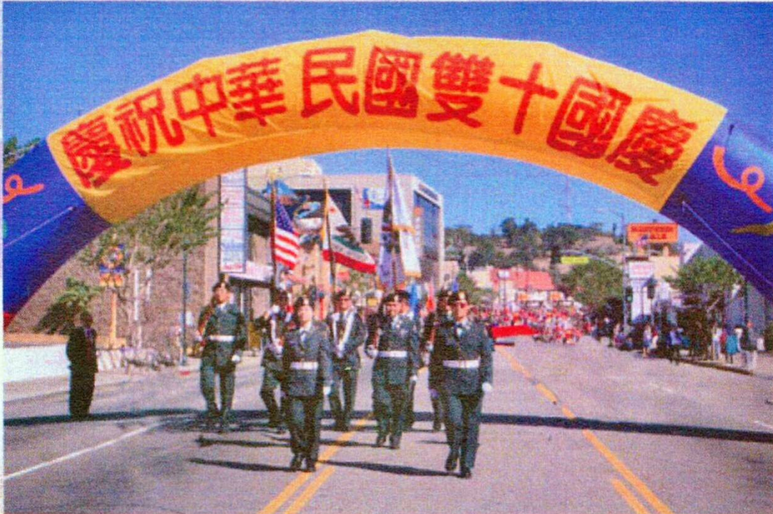
本軍團參加洛杉磯2007年僑界雙十國慶大遊行