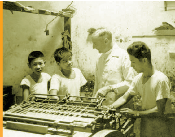
▲杜神父關懷職工，到印刷廠看望印刷師傅及小學徒。