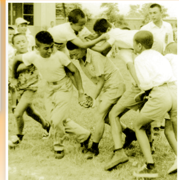
▲騎馬打仗遊戲，培養團隊合作精神。

我們都認為杜神父不喜歡他的子弟兵們做一番大事業而自豪，而他老人家希望我們將他所承受的「