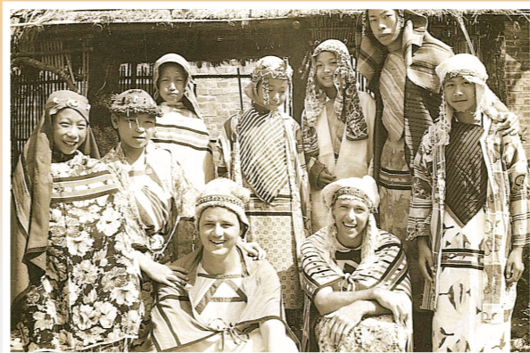
▲夏令營在日月潭舉行，學員開心地穿著原住民服裝合影留念。