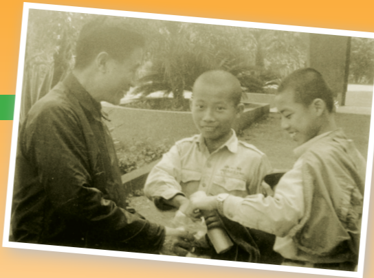
▲至潔學生赴靜山避靜，單國璽樞機主教是當時的院長。

不少學生經過杜華神父的家庭訪問後，被邀請到學生中心住宿，受邀住宿的學生每晚9時以前上課自習，9時念晚課，聆聽睡前道理，每天早上有彌撒，他組織至潔聖母會，經常開會研究聖經，每年帶領參加避靜，他更配合掛圖、講義宣道，從守聖潔、看輕物質生活，到期勉效法教會聖人等，都要求我們從內心遵循。除了每天念早、晚課外，還有下午4