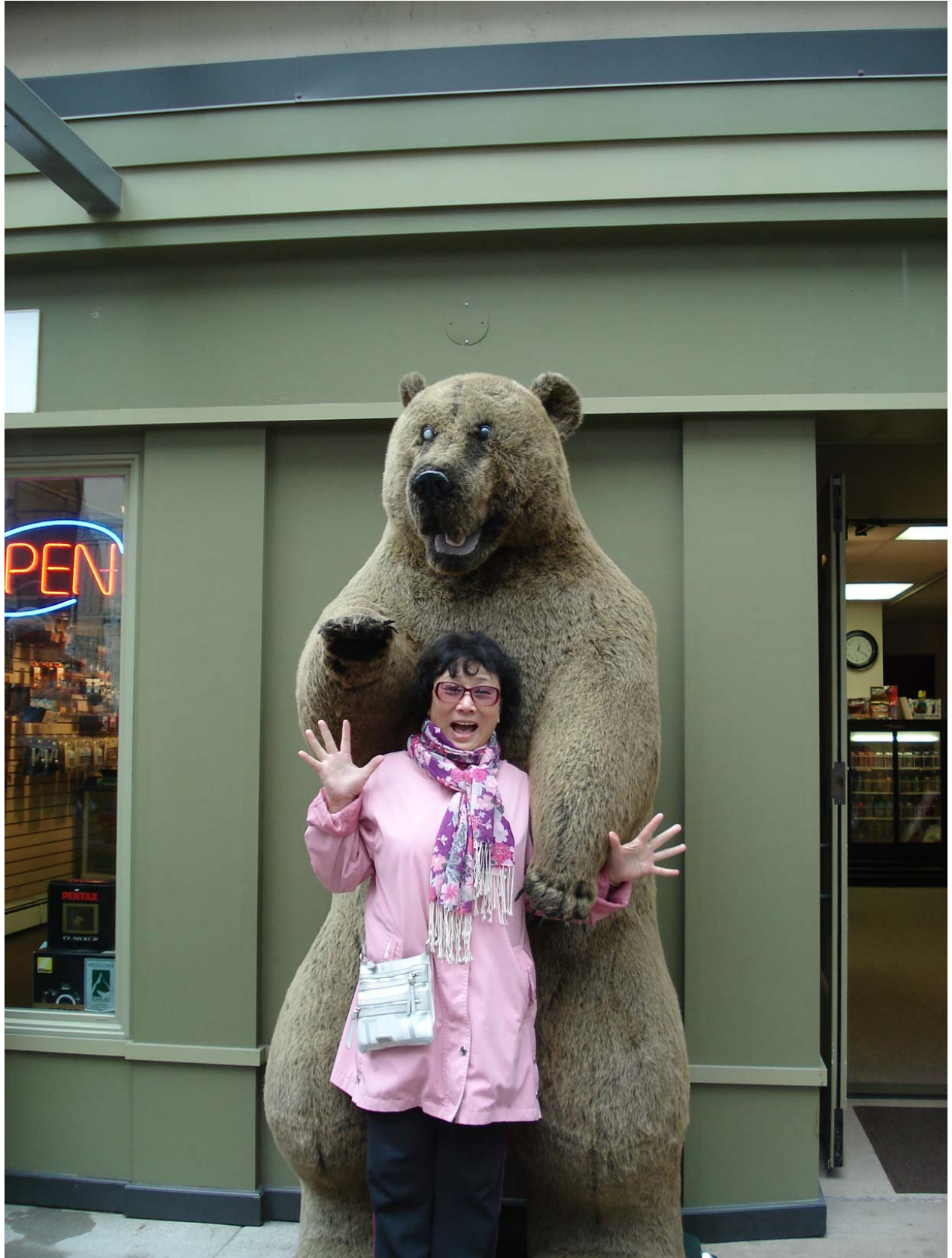
這只棕熊明目張膽地在大街上劫持我。