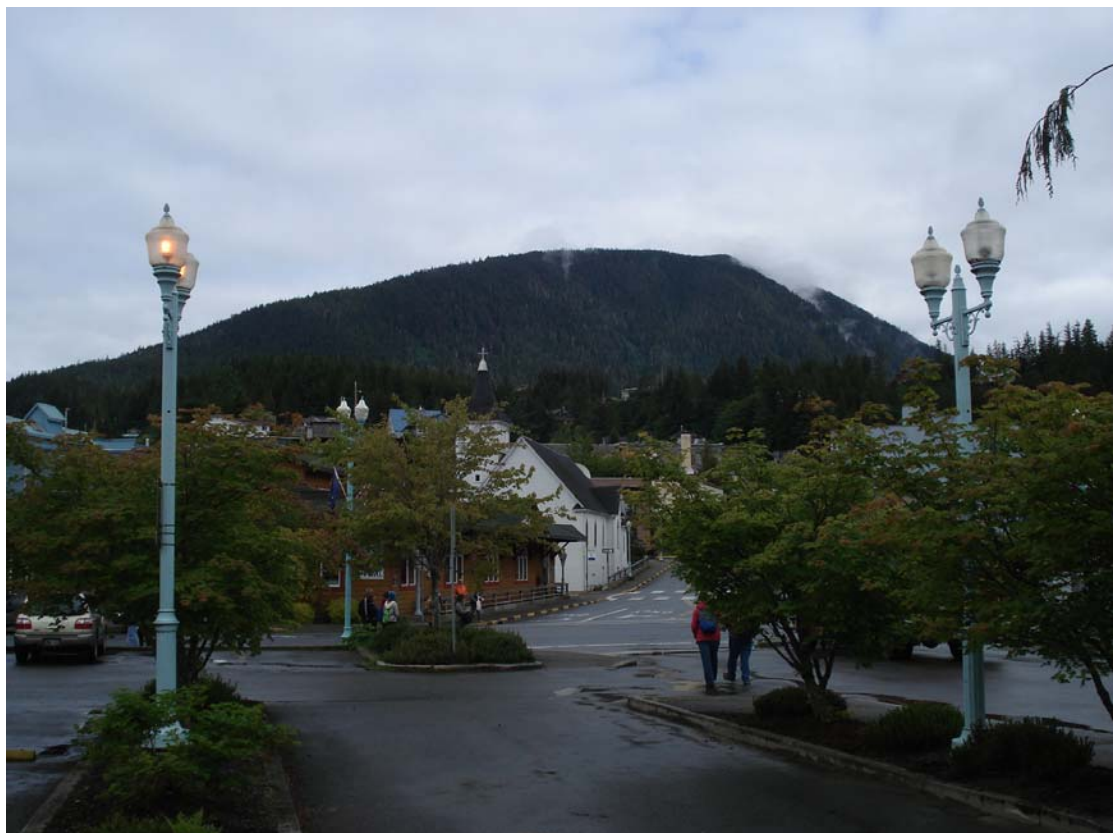
“乾淨又幽靜”是這些小鎮的特點