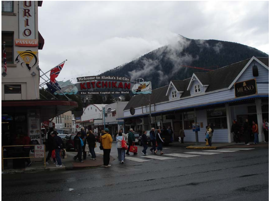
凱其坎碼頭的小鎮