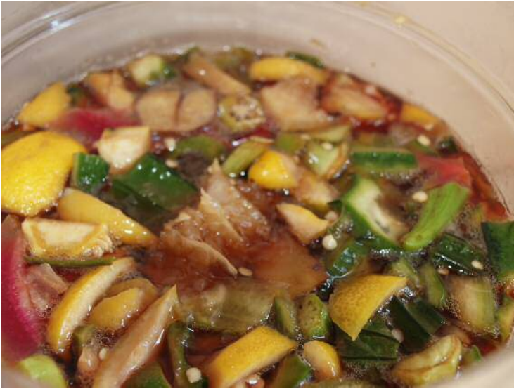
發酵了兩天的環保酵素