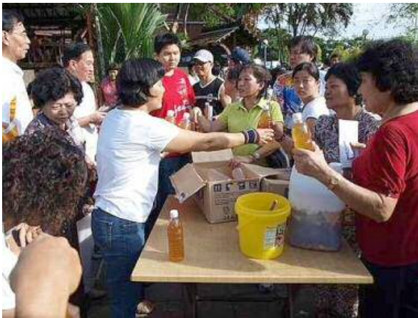
主婦把家裡做好的酵素免費分享