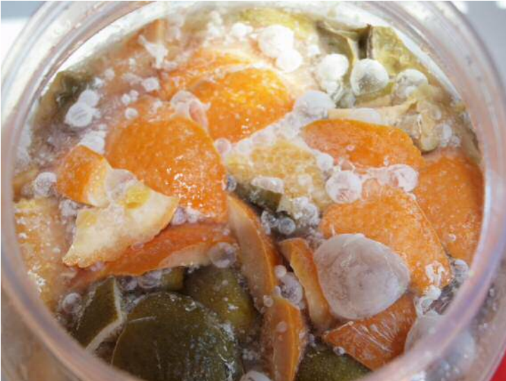
發酵了五天的環保酵素