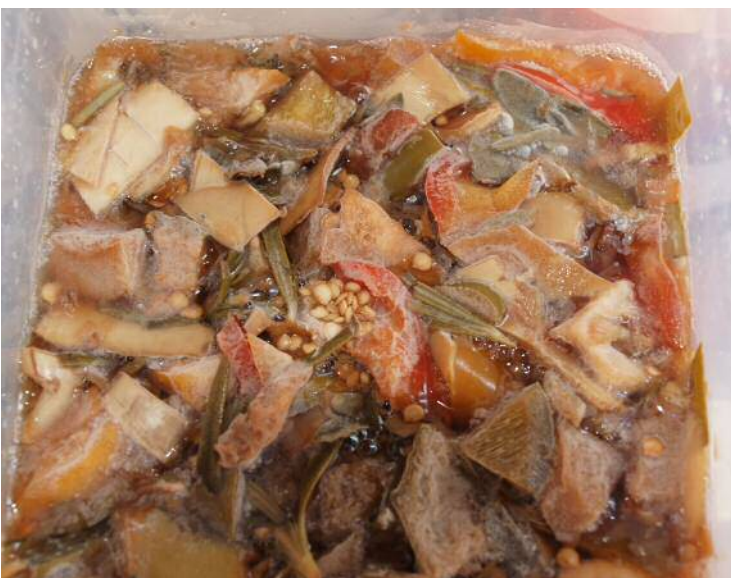
發酵了十天的環保酵素