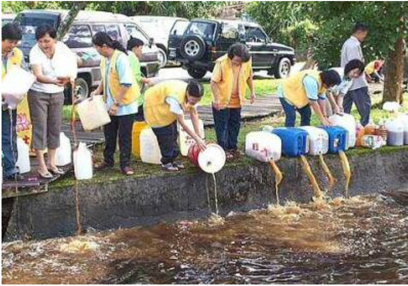
義工 把環保酵素倒入溝渠,河流內

如果有人開餐館,不妨建議店長把果皮蔬菜廚餘做成垃圾酵素,不需要很大的空間. 學校校長,老師可以教小孩製作環保酵素,小孩樂極了!!!