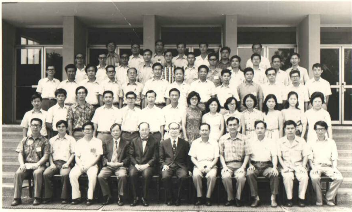
清大數學研究所暑期進修班77級結業留念