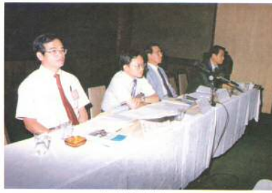
第三級專題研討之一。