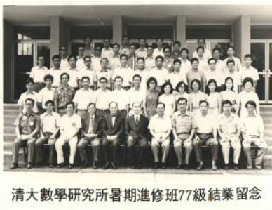
清大數學研究所暑期進修班77級結業留念