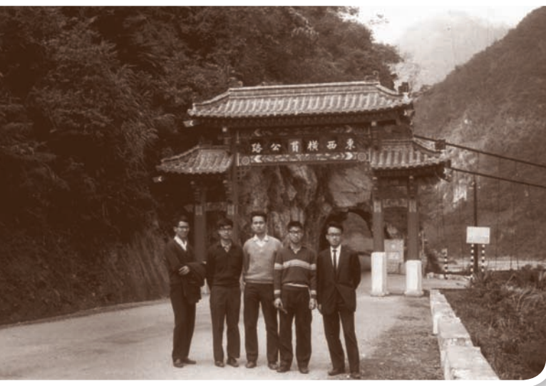
大學有幾個死黨，一起K書一起玩，圖為同遊太魯閣。