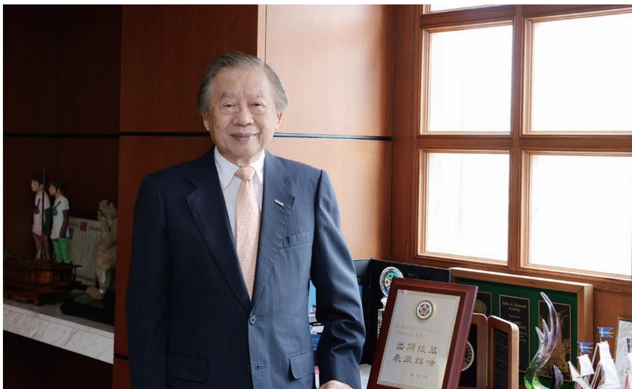
在臺大的邏輯推理訓練和挑戰創新的勇氣，造就他敢於實現創業夢。