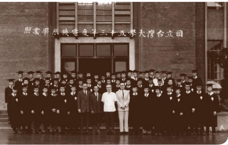
畢業照，與臺大電機系師長合影。