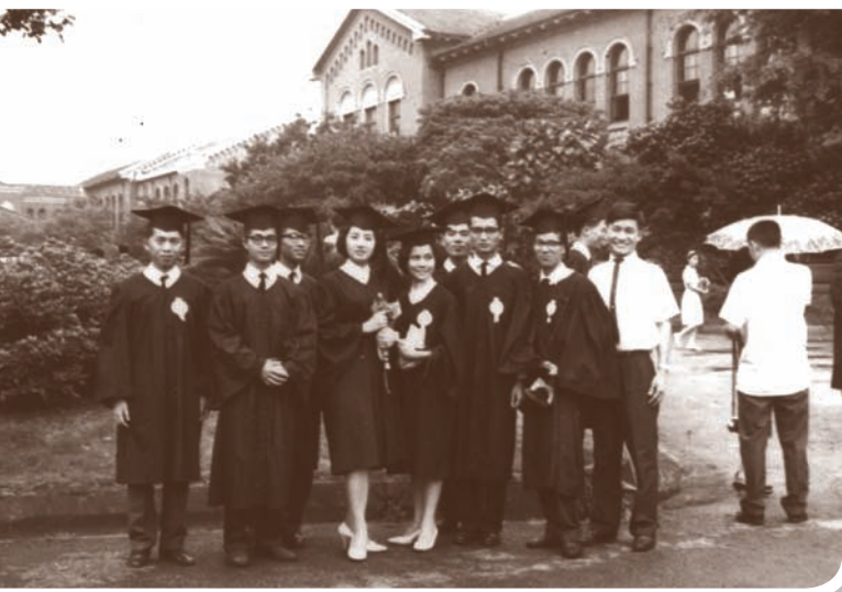
大學4年K書多，沒機會和女生談戀愛，畢業時拍個照留念吧！